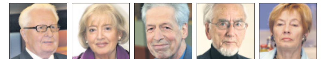
Hans-Jochen Vogel, SPD-Vorsitzender 87-91 Renate Schmidt Bundesministerin a.D. Henning Scherf Bürgermeister a.D. Bremen Erhard Eppler Bundesminister a.D. Christine Bergmann Bundesministerin a.D.

über Jahre die Politik in Deutschland und das Bild der SPD geprägt haben – „damit unser Land besser, gerechter und menschlicher wird“.