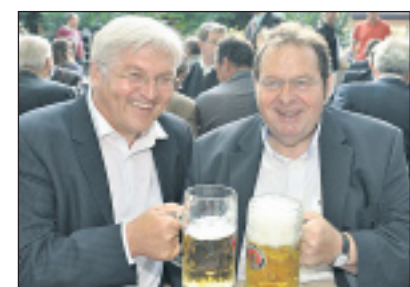
Unterstützung aus Bayern: Ottfried Fischer

Die Erstwählerinnen und Erstwähler engagieren sich in