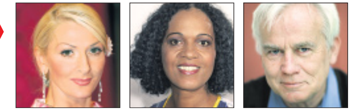
Desiree Nick Entertainerin Mo Asumang Moderatorin Jim Rakete Fotograf

Frank-Walter Steinmeier erhält große Unterstützung mit zahlreichen Projekten, u.a. Wettbewerben, Konzerten, Interviews sowie Internetseiten und Blogs.